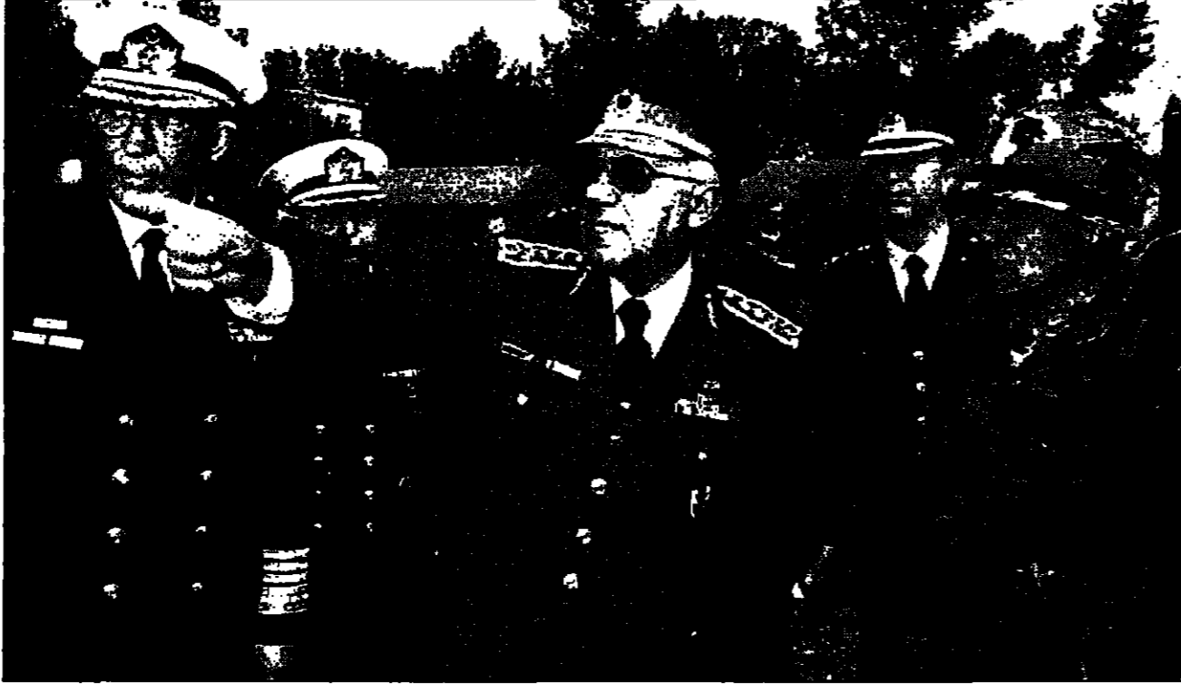
وزير لجان الجيش التركي يمدد الجمعة إلى القوات التركية المنتشرة في البانيا ضمن القوات المتعددة الجنسية